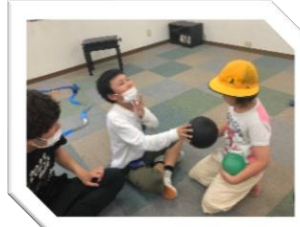
しりとり爆弾ゲーム