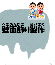
へきめんかざ せいさく 壁面飾り製作