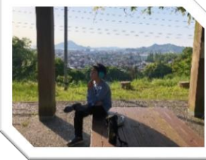
まちたんけん 町探検