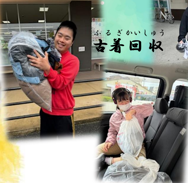
ふるぎかいしゅう 古着回収