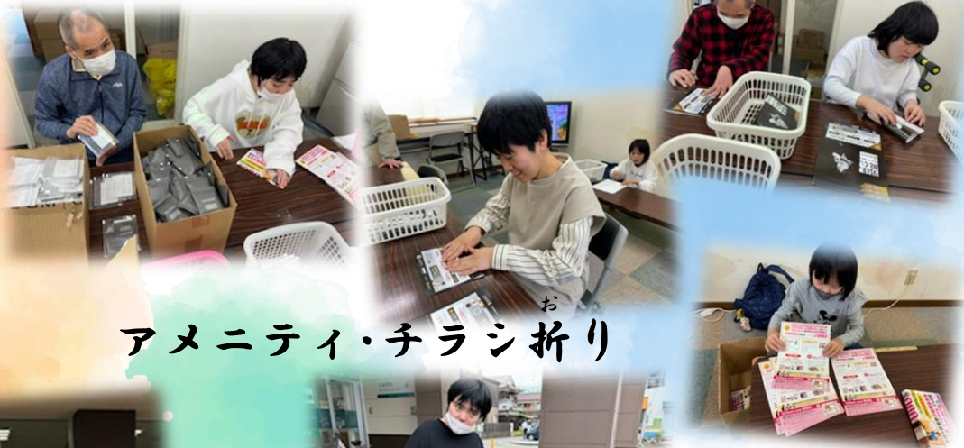
アメニティ・チラシ折り

5月も終わりに梅雨の季節になろうとしています。 1年は本当にあっという間で気づいたらもう折り返し...光の速さで過ぎていく日々...もっともっと楽しい事をしたい!新しい発見を見つけない!こんなことを思う5月でした。少し見方を変えるだけ、いつも行っていることをやめて見守ってみるだけ、そうしていると利用者さん一人一人のできる仕事幅や意識が以前より広がっていることに気づきとてもうれしくなりました。その些細な事の積み重ねを大事にみんなで一緒に成長出来たらいいなと思います。