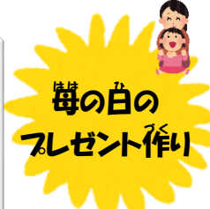
母の日の プレゼント作り